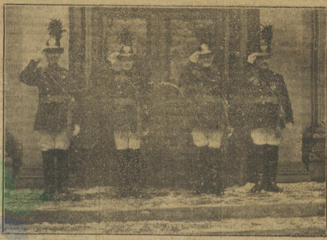
Post negri di Duitschland telah rajahkan 100 taon hari lahirnja Heinrich von Stephan, directeur Post negri pertama, jang 33 taon berselang soeda meninggal doenia. Kreta-kreta post dan pakean-pakean penggawe post koeno ada dipake boeat merameken itoe oepatjara.